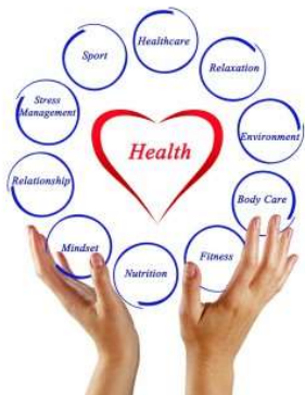
good health υγεία