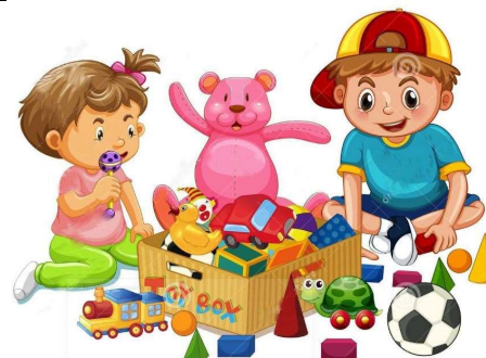
friends to play with φίλους για να παίζω