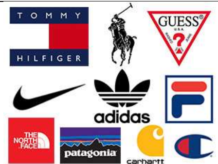
designer clothes ρούχα 'μάρκες'