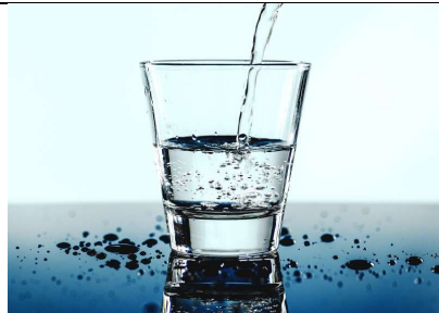
clean drinking water καθαρό πόσιμο νερό