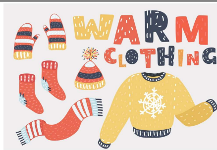
warm clothes ζεστά ρούχα