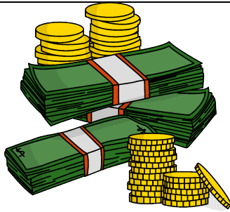
a lot of money πολλά λεφτά

(What is more important to you? Put the objects in the right column)