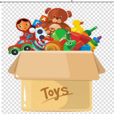
a lot of toys πολλά παιχνίδια