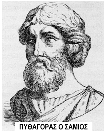
ΠΥΘΑΓΟΡΑΣ Ο ΣΑΜΙΟΣ