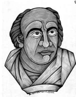
ΕΚΑΤΑΙΟΣ Ο ΜΙΛΗΣΙΟΣ

Κάποιοι θέλησαν να γράψουν για τα περασμένα, για να μην ξεχαστούν.