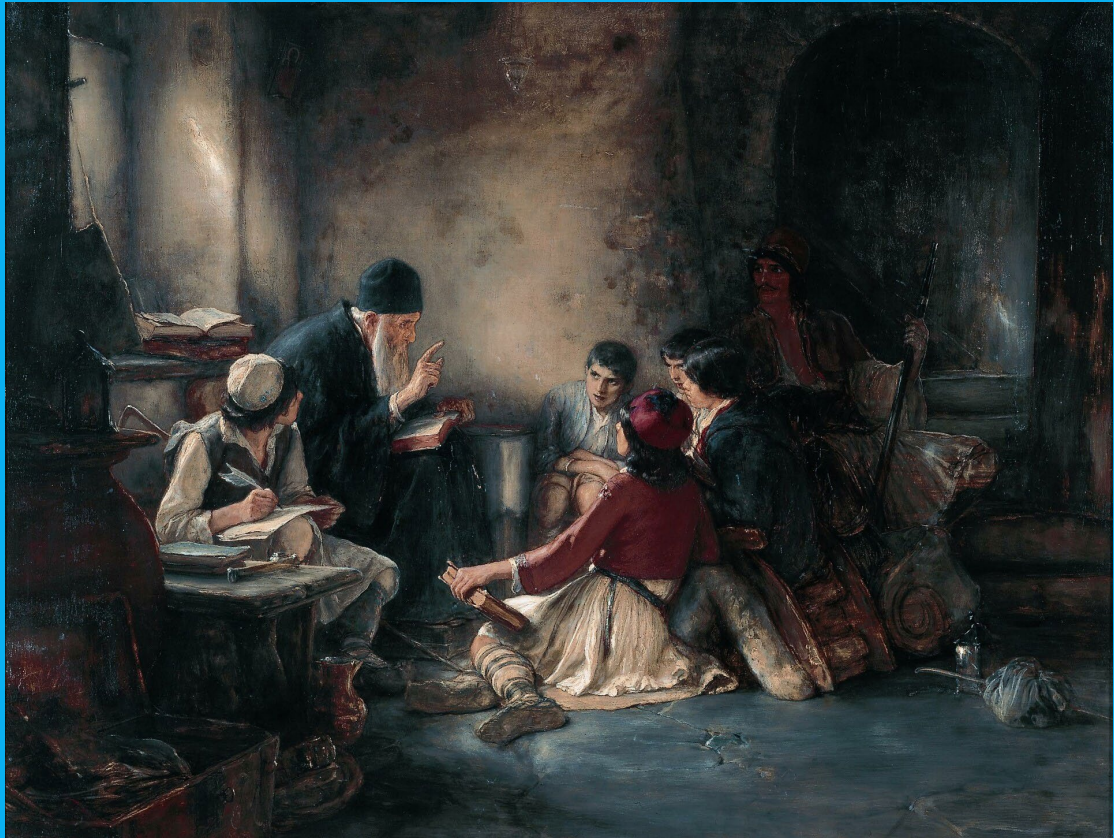
Νικόλαος Γύζης: Κρυφό σχολειό

Σύμφωνα με το θρύλο του « κρυφού σχολείου », η Οθωμανική Αυτοκρατορία απαγόρευε την εκπαίδευση των υπόδουλων Ελλήνων στη διάρκεια της Τουρκοκρατίας , για να εξασφαλίσει την αμάθεια και, έτσι, και τη δουλοφροσύνη τους, με αποτέλεσμα να οργανωθούν κρυφά νυχτερινά σχολεία από ιερείς, που μυστικά δίδασκαν γραφή και ανάγνωση. Ο θρύλος δημιουργήθηκε τα επαναστατικά και μετεπαναστατικά χρόνια και αποτυπώθηκε στην τέχνη. Ως τα μέσα του 20ού αιώνα στα ελληνικά σχολεία διδασκόταν ότι η ελληνική παιδεία διωκόταν συστηματικά τον πρώτο ενάμιση αιώνα μετά την οθωμανική κατάκτηση και πως αυτό οδήγησε την Εκκλησία στην κρυφή λειτουργία τέτοιων σχολείων.