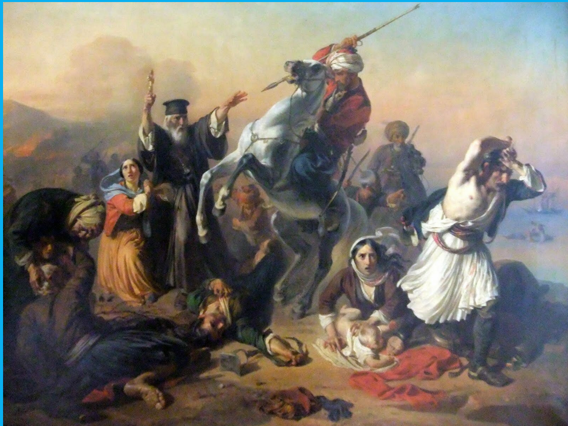
Χydacobe: Σφαγές από τους Τούρκους στους δρόμους των Χανίων

Η εικόνα περιγράφει τη σφαγή της Χίου αναφέρεται στην σφαγή δεκάδων χιλιάδων Ελλήνων της Χίου από τον Οθωμανικό στρατό. Το γεγονός συνέβη 30 Μαρτίου του 1822. Είχε προηγηθεί ο ξεσηκωμός του νησιού στις 11 Μαρτίου 1822, με την απόβαση εκστρατευτικού σώματος Σαμιωτών. Οι Οθωμανοί (ντόπιοι και άλλοι που είχαν έλθει από την Ασία) κλείστηκαν αρχικά στο κάστρο.