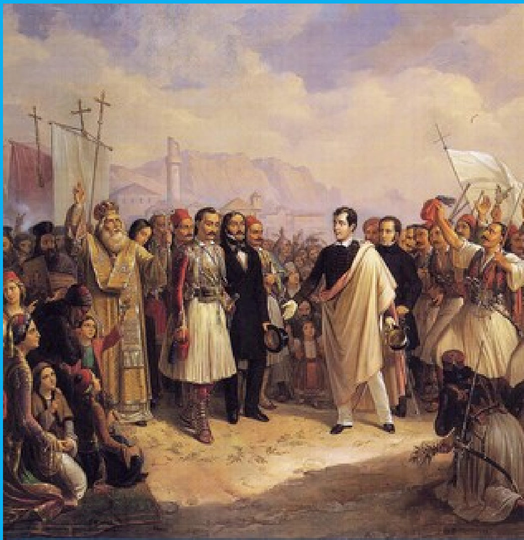
Θεόδωρος Βρυζάκης: Η υποδοχή του Λόρδου Βύρωνα στο Μεσολόγγι

Αυτή η εικόνα περιγράφει την άφιξη του Άγγλου φιλέλληνα Λόρδου Μπάυρον στο Μεσολόγγι κατά την οποία έτυχε θερμής υποδοχής. Εμφανίζεται ερχόμενος από το λιμάνι συνοδευόμενος από τον φίλο του Εδουάρδο Ιωάννη Τρελώνυ και με πλήθος οπλιτών οι οποίοι ζητωκραυγάζουν.