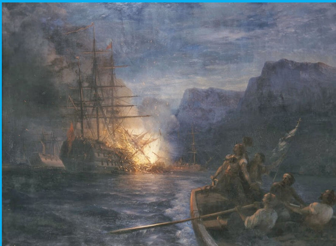
Αϊβαζόφσκι: Η πυρπόληση της τουρκικής ναυαρχίδας στη Χίο

Η εικόνα περιγράφει την πυρπόληση της τουρκικής ναυαρχίδας στη Χίο , τη νύχτα της 6ης προς 7η Ιουνίου 1822, ήταν πολεμικό ναυτικό γεγονός της επανάστασης του 1821 κατά το οποίο ελληνικό πυρπολικό ανατίναξε τη ναυαρχίδα του τουρκικού στόλου ο οποίος είχε καταστρέψει τη Χίο.