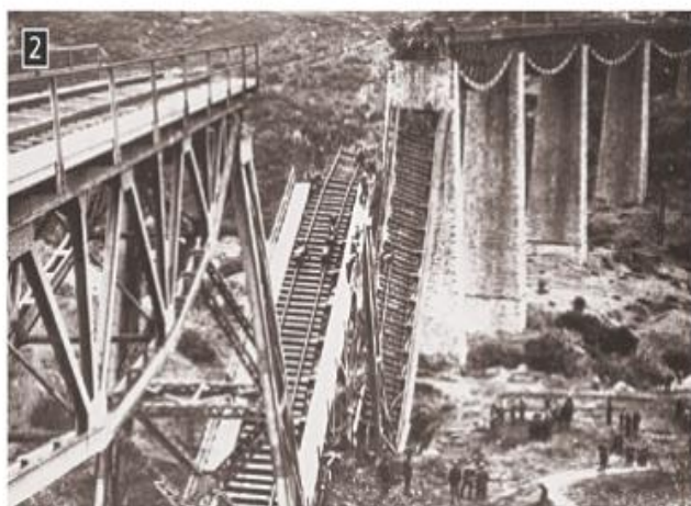
▲ Η γέφυρα του Γοργοποτάμου που ανατινάχθηκε από τις αντιστασιακές δυνάμεις, φωτ. Αρχείο ΔΟΛ