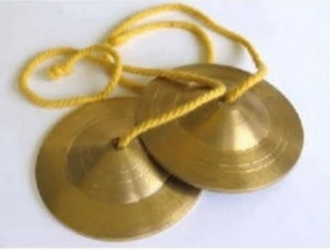
κύμβαλα - πιατίνια