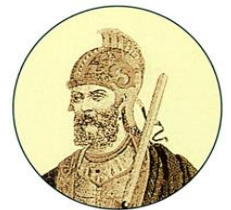
Ρωμανός Δ΄, ο Διογένης