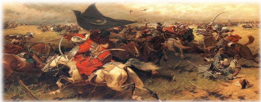
Η μάχη του Ματζικέρτ