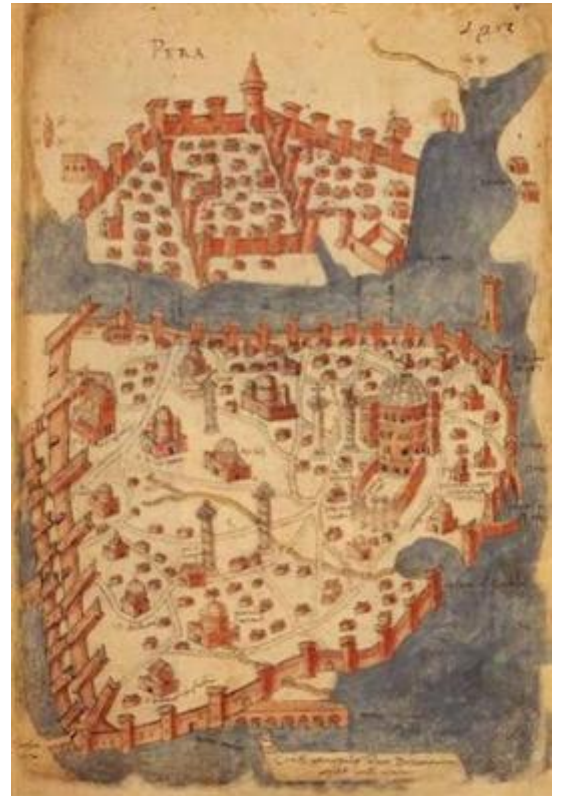
Η Κωνσταντινούπολη και ο Γαλατάς