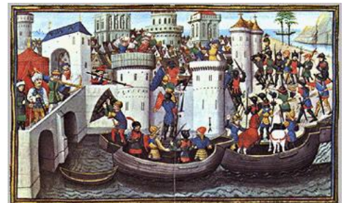
Η άλωση της Πόλης το 1204