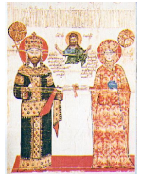
Ο Αλέξιος Γ' Κομνηνός και η σύζυγός του Θεοδώρα