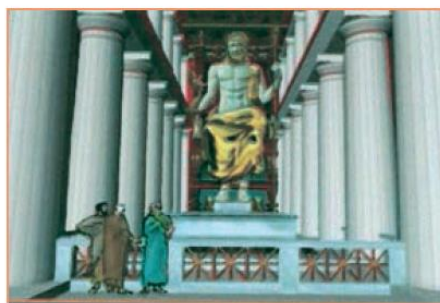
Αξονική άποψη του αγάλματος του Δία