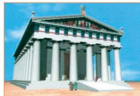
Γενική άποψη του ναού από νοτιοανατολικά

Η ψηφιακή αναπαράσταση του ναού είναι τόσο ακριβής, ώστε να διακρίνονται πολλές από τις αρχιτεκτονικές του λεπτομέρειες. Οι επισκέπτες έχουν τη δυνατότητα να θαυμάσουν το φημισμένο άγαλμα του Δία, δημιούργημα του γλύπτη Φειδία και ένα από τα επτά θαύματα του αρχαίου κόσμου, από το οποίο σήμερα δε σώζεται τίποτε, αλλά και τις μετόπες από τις περίφημες αναπαραστάσεις των άθλων του Ηρακλή. Επίσης, κοντά στον οπισθόδομο έχει τοποθετηθεί μια αγριελιά, που αναπαριστά την «Καλλιστέφανο Ελαία», τα κλαδιά της οποίας χρησίμευαν για να φτιάχνονται τα στεφάνια των ολυμπιονικών. Το ψηφιακό μοντέλο του ναού του Δία πλαισιώνουν η τοποθεσία της αρχαίας Άλτης και το καταπράσινο τοπίο του Κρόνιου λόφου και της Ολυμπίας, επιτυγχάνοντας μια ελεύθερη εικονική απόδοση του χώρου που περιέβαλλε το ναό.