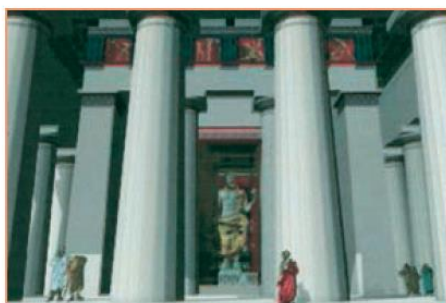
Αξονική άποψη της ανατολικής όψης με θεά στο σηκό