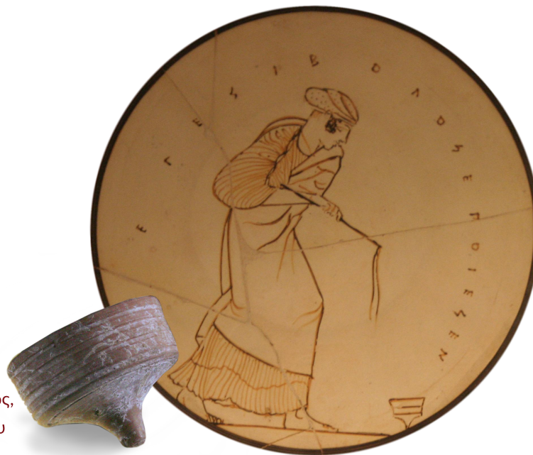
Πήλινη σβούρα, Ελληνιστική περίοδος, Παρίσι, Μουσείο του Λούβρου