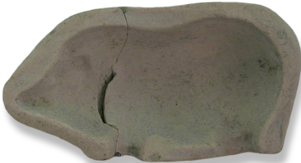
Καλούπι κουδουνίστρας με σχήμα αγριογούρουνου, Τάραντας, Εθνικό Αρχαιολογικό Μουσείο