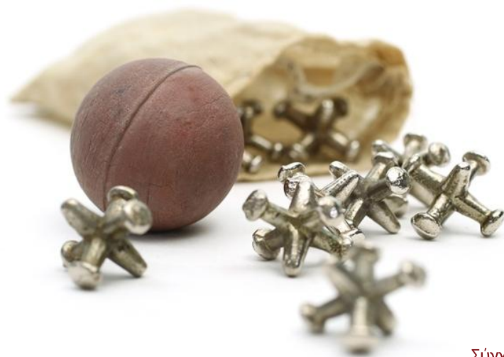
Σύγχρονοι αστράγαλοι (Knucklebones), Ινδιανάπολη, Μουσείο των παιδιών