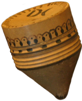
Πήλινη σβούρα, Ελληνιστική περίοδος, Παρίσι, Μουσείο του Λούβρου

Ένα παιχνίδι το οποίο έπαιζαν ακόμη και ενήλικες άντρες ήταν το στεφάνι ή αλλιώς, ο τροχός . Το παιδί έριχνε το στεφάνι και έπρεπε, χρησιμοποιώντας επιδέξια ένα ραβδί, να το κρατήσει σε κίνηση. Οι ενήλικες έπαιζαν το στεφάνι στις παλαιστές για να γυμνάζονται. Ήταν φτιαγμένο από χαλκό, είχε μεγάλο μέγεθος και ήταν βαρύτερο σε σχέση με το αντίστοιχο παιδικό παιχνίδι.