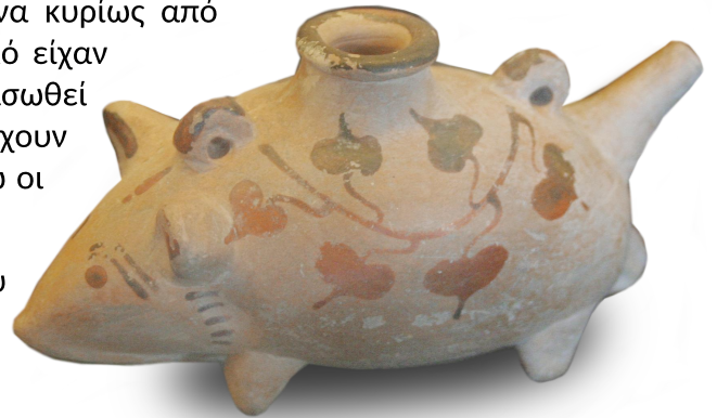
Θήλαστρο με σχήμα ποντικιού, 450 π.Χ., Παρίσι, Μουσείο του Λούβρου

Τα παιδιά είχαν ευκαιρία να πάρουν δώρα και στα γενέθλιά τους, στην αρχή του χρόνου και σε θρησκευτικές εορτές όπως τα Ανθεστήρια, προς τιμή του Διονύσου.