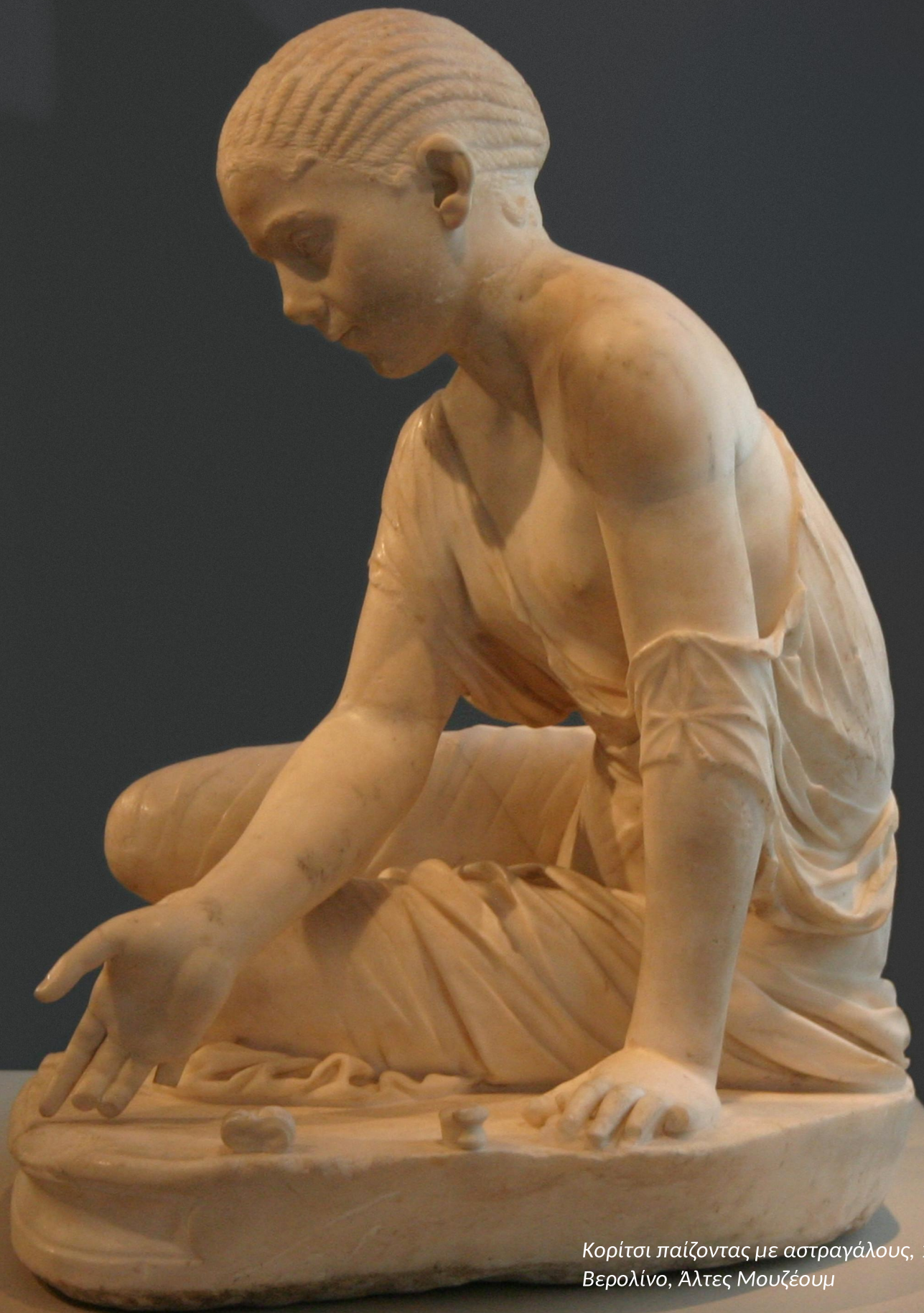
Κορίτσι παίζοντας με αστραγάλους, 150 μ.Χ., Βερολίνο, Άλτες Μουζέουμ