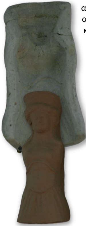
Καλούπι κούκλας, Τάραντας, Εθνικό Αρχαιολογικό Μουσείο

Με αυτήν την τεχνική, ο κοροπλάστης έφτιαχνε πρώτα μια μήτρα πάνω σε ένα αρχικό μοντέλο και τη γέμιζε με υγρό πηλό. Όταν ο πηλός στέγνωνε, τον απομάκρυνε από τη μήτρα. Το παιχνίδι όμως δεν ήταν ακόμη έτοιμο. Έπρεπε να καλυφθεί με λευκό επίχρισμα, να ψηθεί στο φούρνο και τέλος, να χρωματιστεί.