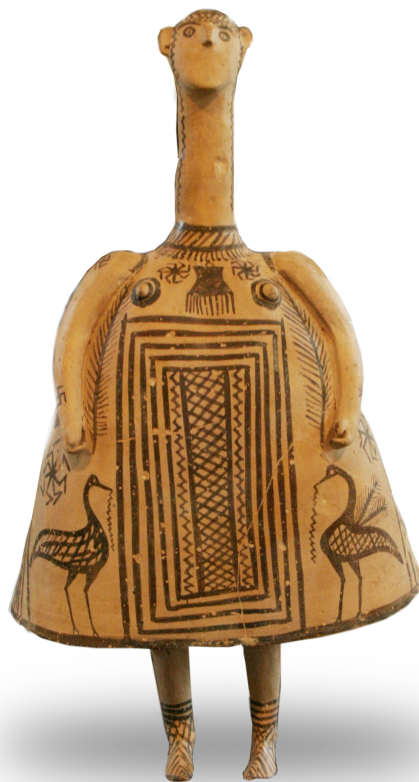
Κουδουνίστρα, 700 π.Χ., Παρίσι, Μουσείο του Λούβρου