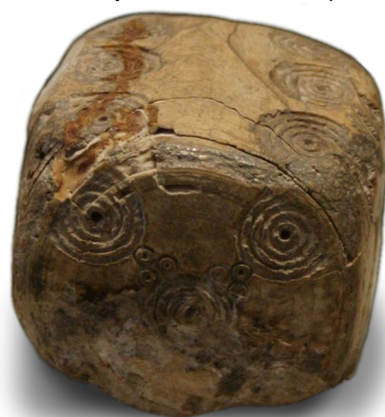
Ζάρι, Αυτοκρατορική Ρωμαϊκή περίοδος, Μιλάνο, Αρχαιολογικό Μουσείο

Τα ζάρια ή πεσσοί , όπως και στις μέρες μας, είχαν σημεία σε κάθε πλευρά, από το 1 μέχρι το 6. Ανήκουν στην κατηγορία των τυχερών παιχνιδιών και παίζονταν επίσης από τους άντρες. Ήταν από πηλό, οστά, ελεφαντοστό, χαλκό ή άλλο πολύτιμο μέταλλο.