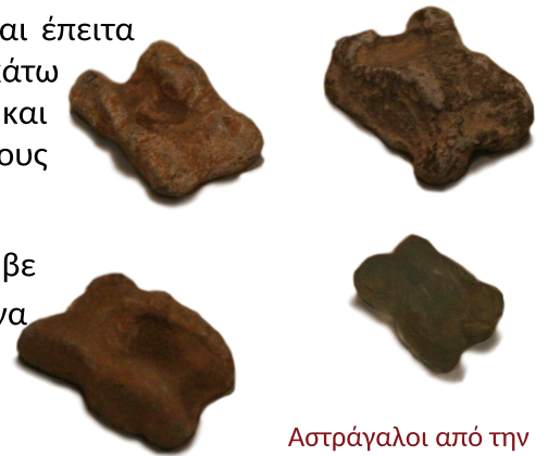
Αστράγαλοι από την Πομπηία, Βερολίνο, Άλτες Μουζέουμ