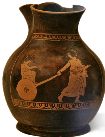
Χους, παιδιά παίζουν με αμαξάκι, 450-350 π.Χ., Βρυξέλλες, Βασιλικά Μουσεία Τέχνης και Ιστορίας