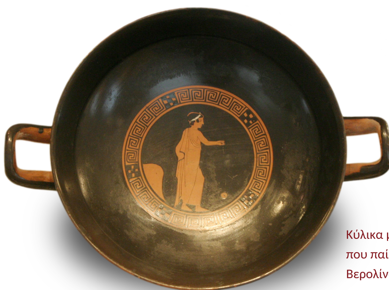
Κύλικα με παράσταση νεαρού που παίζει γιο-γιο, 440-420 π.Χ., Βερολίνο, Άλτες Μουζέουμ