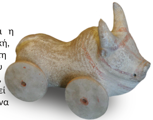
Βόδι με ρόδες, αρχαϊκή εποχή, Παρίσι, Μουσείο του Λούβρου