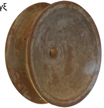
Γιο-γιο, Ελληνιστική περίοδος, Παρίσι, Μουσείο του Λούβρου