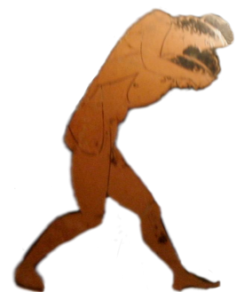
Εφεδρισμός, 430-420 π.Χ., Βερολίνο, Άλτες Μουζέουμ