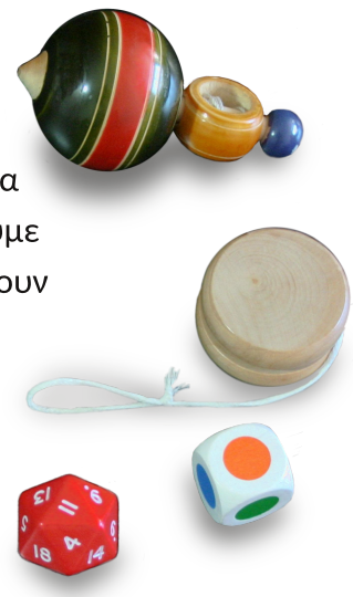
Σύγχρονα παιχνίδια που δείχνουν την επιρροή από τα αρχαία παιχνίδια

Τα παιχνίδια όμως δεν σταμάτησαν ποτέ να εξελίσσονται. Κατά το πέρασμα του χρόνου άλλαξαν υλικό, μορφή και όνομα, αλλά η ουσία παρέμεινε ίδια. Αξίζει τον κόπο μια βόλτα στο μουσείο, να τα δούμε από κοντά και να εντυπωσιαστούμε που πολλά από αυτά υπάρχουν ακόμα και σήμερα.