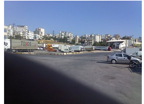
Άποψη του Κερατσινίου απο την περιοχή της Ιχθυόσκαλας

Απο την περιοχή της Ιχθυόσκαλας ξεκινούν οι μεγαλύτεροι συγκοινωνιακοί κόμβοι του Πειραιά όπως η Λεωφόρος Σχιστού, η Λεωφόρος Δημοκρατίας που συνδέει τα Ταμπούρια με το Πέραμα , η Οδός Πέτρου Ράλλη που διασχίζει την Κοκκινιά και η Λεωφόρος Γρηγορίου Λαμπράκη που διασχίζει τον Κορυδαλλό .