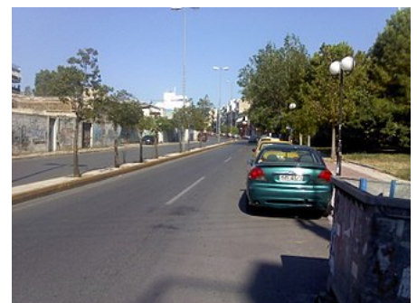
Λεωφόρος Δημοκρατίας - Κερατσίνι