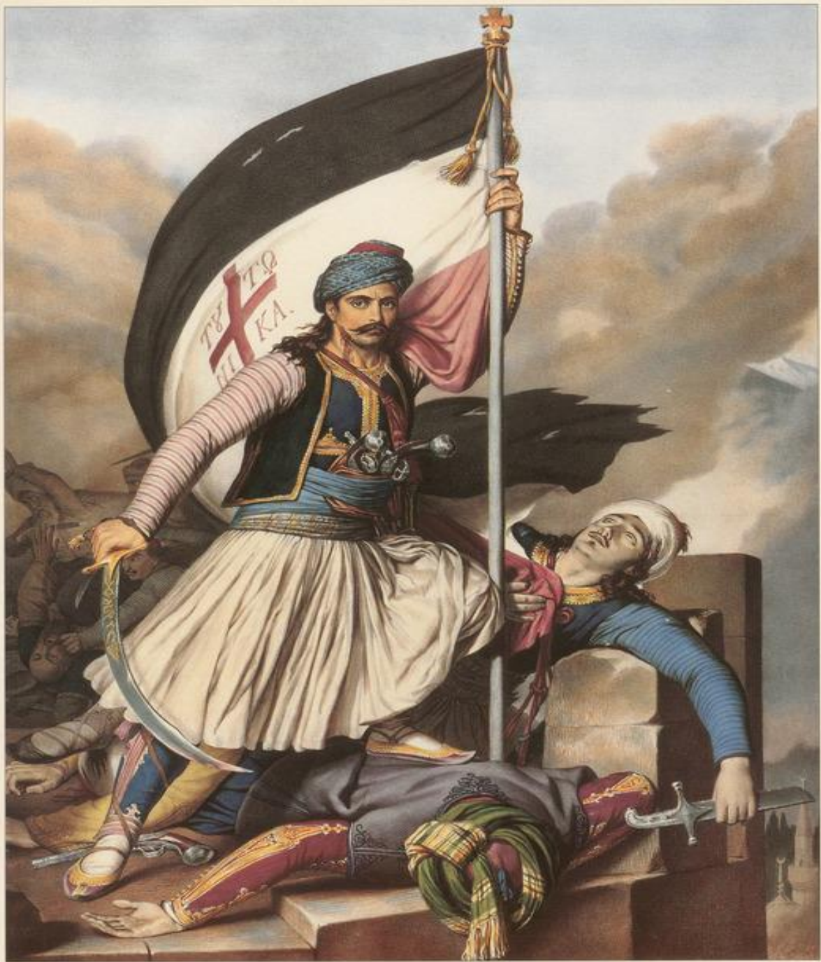
80. Ο ΝΙΚΟΛΑΚΗΣ ΜΗΤΡΟΠΟΥΛΟΣ

υψώνει τη σημαία με το σταυρό στα Σάλωνα, την ημέρα του Πάσχα του 1821.