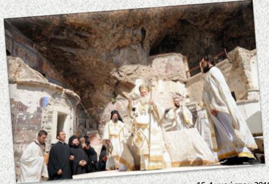
15 Αυγούστου 2010

Τον Ιούνιο του 2010 το Τουρκικό Κράτος έδωσε άδεια στο Οικουμενικό Πατριαρχείο Κωνσταντινουπόλεως για να τελεστεί στη μονή η λειτουργία για την γιορτή της Κοιμήσεως της Θεοτόκου, στις 15 Αυγούστου 2010, με την Τουρκία να προσδοκά τόσο στην έξωθεν καλή μαρτυρία για σεβασμό των θρησκευτικών ελευθεριών όσο και σε οικονομικά οφέλη από την αύξηση των τουριστών στην περιοχή τις ημέρες αυτές.. Αυτή ήταν η πρώτη φορά ύστερα από 88 χρόνια που το μοναστήρι λειτούργησε ξανά ως εκκλησία, καθώς τα τελευταία χρόνια είχε μετατραπεί σε μουσείο.