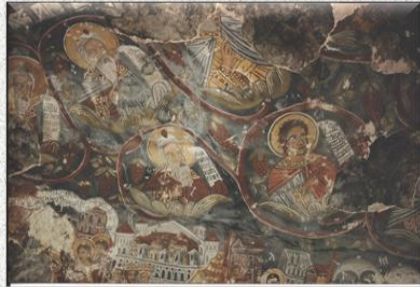
Τοιχογραφία στη Μονή Σουμελά

Η θαυματουργός εικόνα, που σύμφωνα με την παράδοση χαραχθηκε από τον Ευαγγελιστή Λουκά πάνω σε ξύλο, αποτελούσε, μαζί με το αγιασματικό νερό με τις θεραπευτικές ιδιότητες, το σημείο αναφοράς της Μονής.