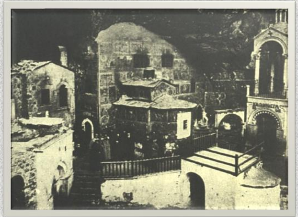
Η μονή Παναγίας Σουμελά το 1902

Στο όρος Μελά της Τραπεζούντας, σε υψόμετρο 1063 μέτρα, σε μία σπηλιά ιδρύθηκε το 386 μ.Χ. με αποκάλυψη της Παναγίας, το μοναστήρι της Παναγίας της Σουμελάς, είναι ένα πασίγνωστο χριστιανικό ορθόδοξο μοναστήρι, σύμβολο επί 16 αιώνες του Ποντιακού Ελληνισμού. Η μονή χτίστηκε από δύο Αθηναίους μοναχούς, τον Βαρνάβα και Σωφρόνιο και δόθηκε το συγκεκριμένο όνομα διότι οι εκεί Πόντιοι έλεγαν συχνά «θα ανέβουμε σου Μελά την Παναΐαν».