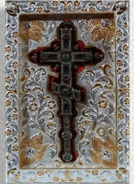
Ο σταυρός του Μανουήλ Γ' Κομνηνού

Πράγματι, ο μοναχός κατάφερε να πάρει μαζί του τα κειμήλια που αποτελούν μέχρι σήμερα σύμβολο της πίστεως και της ορθοδοξίας.