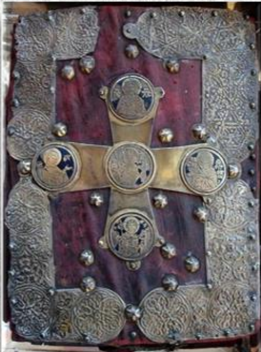
Το χειρόγραφο Ευαγγέλιο του οσίου Χριστοφόρου

Ωστόσο, η βάρβαρη συμπεριφορά των Νεότουρκων και των Κεμαλικών προς τα μοναστήρια του Πόντου, οδήγησε στην ολοκληρωτική καταστροφή της μονής το 1922. Λίγο αργότερα, πριν τον ξεριζωμό και την αναγκαστική έξοδο του 1923, οι μοναχοί έκρυψαν την εικόνα μαζί με Σταυρό με τίμιο ξύλο του Μανουήλ Γ' ανεκτίμητης αξίας, αλλά και ένα χειρόγραφο ευαγγέλιο του οσίου Χριστοφόρου, στο παρεκκλήσι της Αγίας Βαρβάρας.