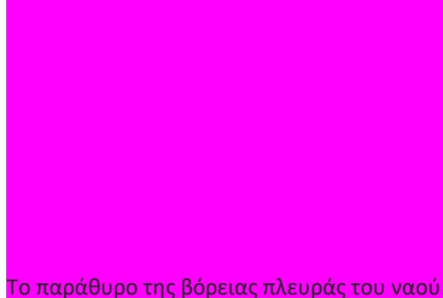
Το παράθυρο της βόρειας πλευράς του ναού.

Πριν από την εμφάνιση του Χριστιανισμού στη Γαλλία, στη θέση που είναι σήμερα η Παναγία των Παρισίων, υπήρχε Ρωμαϊκός ναός αφιερωμένος στον Δία. Πριν την Παναγία των Παρισίων θεμελιώθηκαν 4 εκκλησίες επάνω στα θεμέλια αυτού του αρχαίου ναού, που ήταν αφιερωμένος στον Δία.