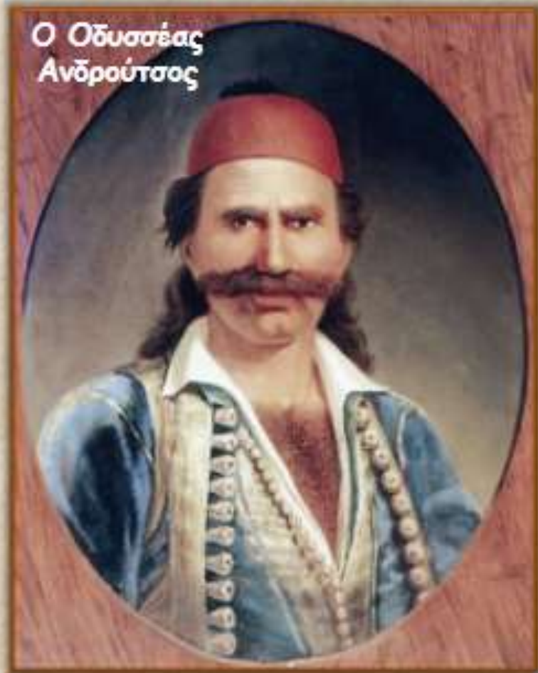
Ο Οδυσσέας Ανδρούτσος

Ο Οδυσσέας Ανδρούτσος, από τους σημαντικότερους αγωνιστές του 1821, που οι φίλοι τον αποκαλούσαν ΓεροΧουλιάρα για τις πονηριές και τα ξαφνιάσματά του, γεννήθηκε το 1788 ή το 1790 στην Ιθάκη ή στην Πρέβεζα, και στραγγαλίστηκε στις 5 Ιουνίου 1825, στην Ακρόπολη της Αθήνας, όπου κρατούνταν φυλακισμένος.