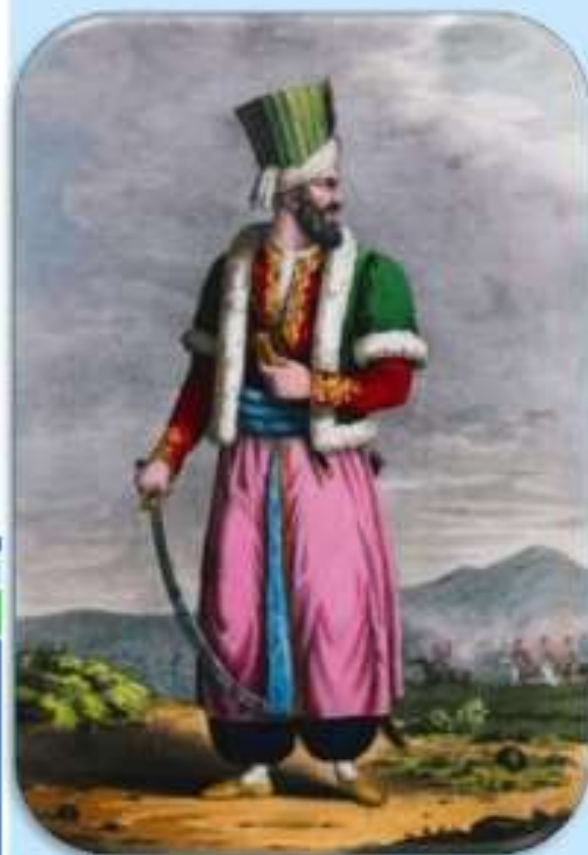
Ο Χουρσίτ πασάς

Οι συνθήκες για εξέγερση στη Στερεά Ελλάδα (Ρούμελη) ήταν δύσκολες διότι: