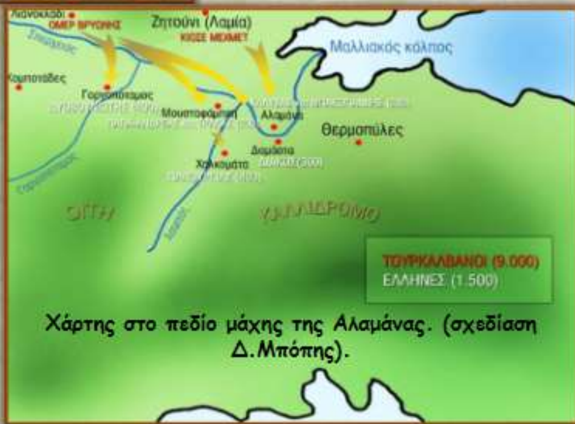
Χάρτης στο πεδίο μάχης της Αλαμάνας. (σχεδίαση Δ.Μπόπης).