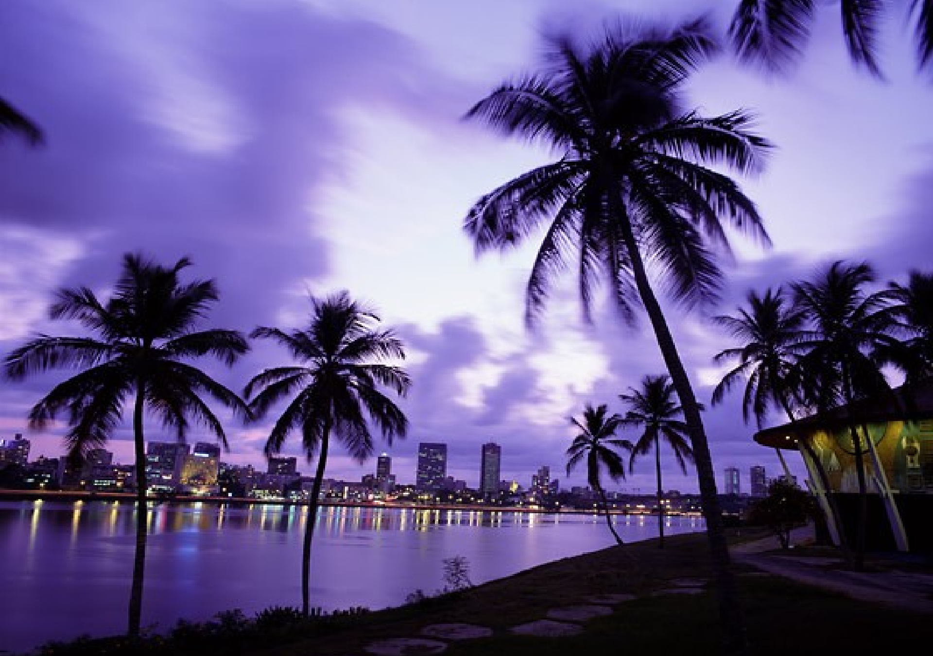
Costa do Marfim