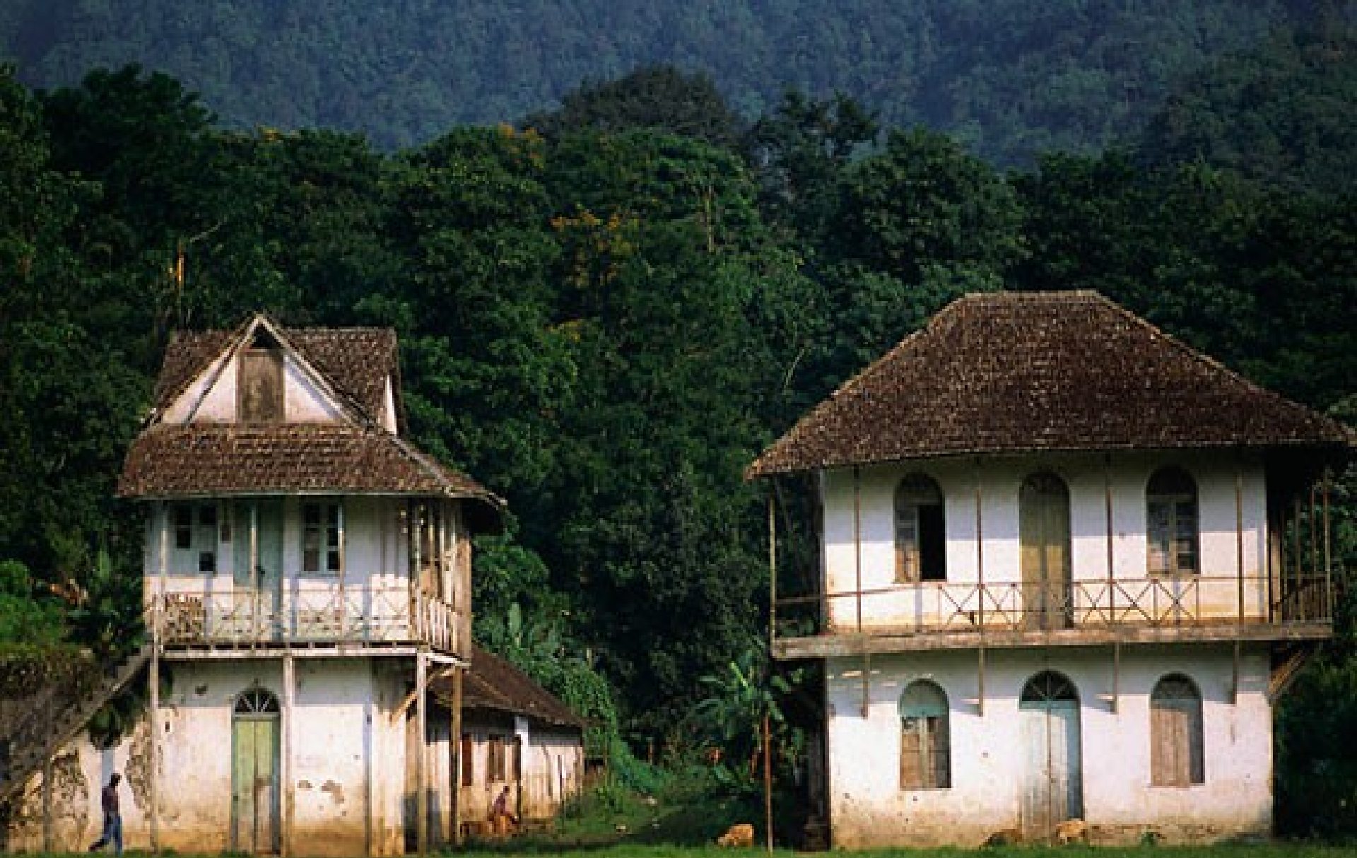
São Tomé e Príncipe