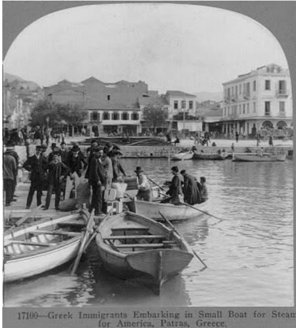
17100—Greek Immigrants Embarking in Small Boat for Steamship for America, Patras, Greece,