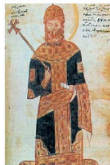
1. Ο Μιχαήλ Η΄, ο Παλαιολόγος, στέφτηκε αυτοκράτορας και στην Αγία Σοφία.