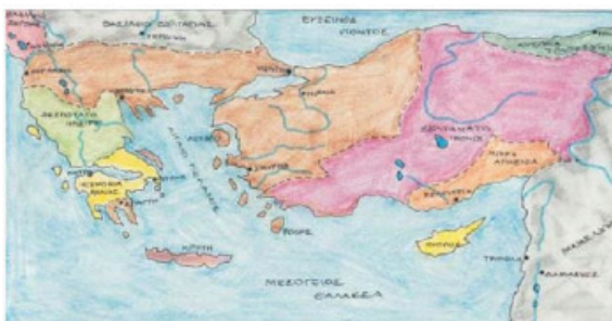
6. Η Βυζαντινή αυτοκρατορία μετά την ανάκτηση της Κωνσταντινούπολης. Με κίτρινο χρώμα σημειώνονται τα λατινικά κράτη που δημιουργήθηκαν μετά τη Δ' Σταυροφορία.

Η Κωνσταντινούπολη έμεινε χωρίς συμμάχους και οι εχθροί ήταν πολλοί. Στην Ανατολή παραμόνευαν τα τουρκικά φύλα, στο Βορρά απειλούσαν οι Σέρβοι και οι Βούλγαροι, στη δύση οι Φράγκοι και οι Βενετοί. Όλα φανέρωναν πως η αυτοκρατορία οδηγούνταν προς την τελική πτώση.