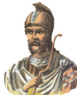
Μιχαήλ Η΄, ο Παλαιολόγος