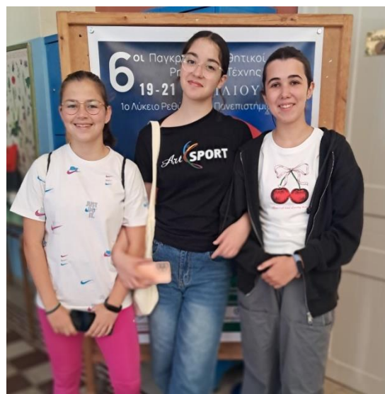
Η ομάδα του Προτρεπτικού Λόγου

Απόσπασμα από την ανακοίνωση διεξαγωγής των Αγώνων από τον Σύνδεσμο Φιλολόγων Ρεθύμνου :