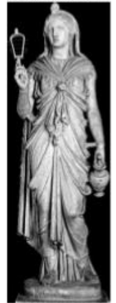
Η ΘΕΑ ΙΣΙΔΑ